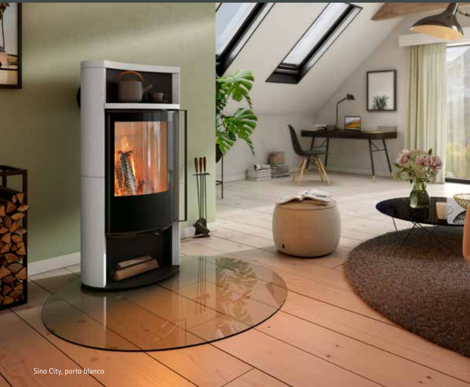
Sino City, porto blanco